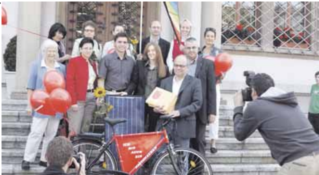
Einreichung der Energieinitiative am 13. September 2007 vor dem Regierungsgebäude in Schwyz.