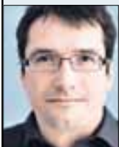
Christian Levrat Präsident der SP Schweiz

2010 droht für unsere Sozialwerke zum Schicksalsjahr zu werden: Die Bürgerlichen sind entschlossen, in den kommenden Monaten gleich mehrere Sozialwerke zu schröpfen – wie immer bereitwillig motiviert, assistiert und «gut» beraten von den Wirtschaftsverbänden. Eine geballte Ladung Sozialabbau rollt auf uns zu – und das ausgerechnet in der Krise. Dass ausgerechnet diejenigen, die für den ganzen Schlamassel verantwortlich sind, jetzt auch noch das soziale Netz ausdünnen wollen, ist an Dreistigkeit eigentlich kaum mehr zu überbieten.