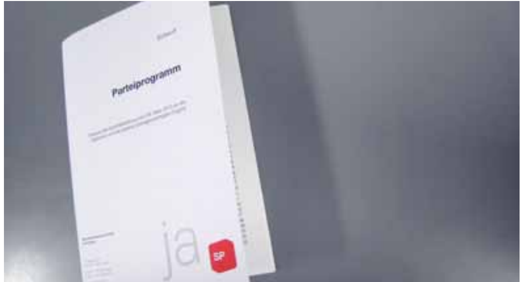
Die Grundwerte der französischen Revolution sind die Basis unseres Parteiprogramms.

Das nächste «links» widmet sich nochmals dem neuen Parteiprogramm. Wie findest du das neue Grundsatzpapier? Schreibe uns bis spätestens Ende Mai an parteiprogramm@spschweiz.ch oder SP Schweiz, Spitalgasse 34, 3001 Bern. Je pointierter deine Zuschrift, umso grösser die Chance, dass sie veröffentlicht wird. Den Entwurf findest du übrigens unter www.spschweiz.ch/parteiprogramm .