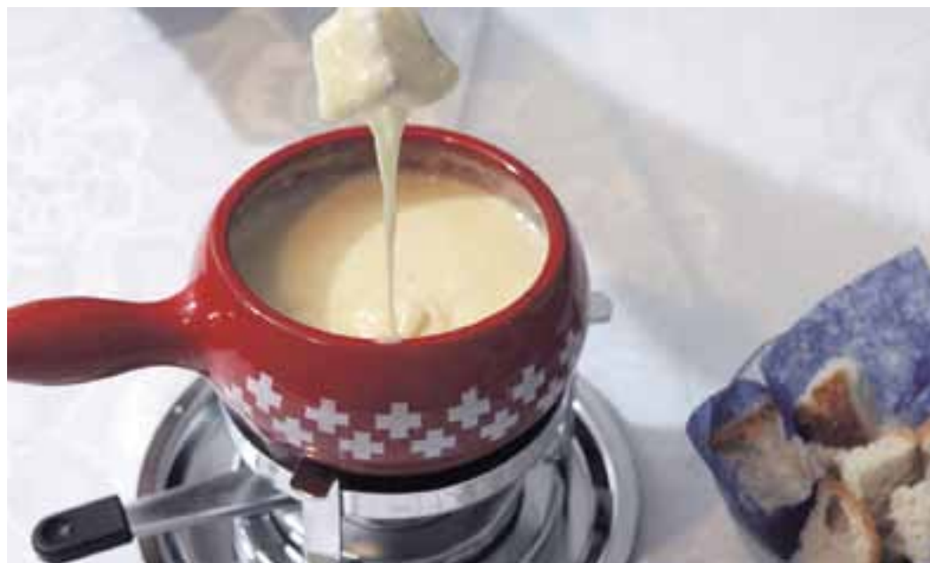
Schweizer Fondue: Etwas, das irgendwo in der Schweiz aus rumänischem Käse und algerischem Weisswein angerührt wurde?

Die Wirkung einer solchen Regelung wäre bei Lebensmitteln verheerend: Mit derselben verqueren Logik gäbe es dann «Schweizer Wein» aus 100 Prozent griechischen Trauben, «Schweizer Käse» aus 100 Prozent norddeutscher Milch oder ein «Schweizer Fondue», das